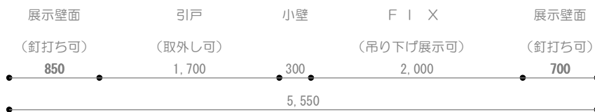
展開図 a S = 1 / 50