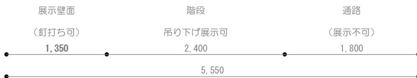
展開図 b S = 1 / 50